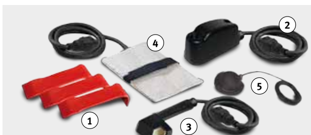
Lieferumfang IHG 2400: IHG 2400, ① Kombi Raket/Hebel (3-tlg.), ② Scheibenablöser, ③ Metalllöser, ④ Induktionspad, ⑤ pneumatischer Fußschalter

Dank innovativem Gesamtkonzept, intelligenter Steuerungstechnik und passendem Zubehör ergeben sich für den Anwender folgende praktische Vorteile: Einfach und schnell zu bedienen Automatische Erkennung von ange-schlossenem Zubehör Einstellung manuell oder automatisch Automatische Leistungs- und Frequenzregelung Akustische Statusmeldungen